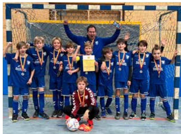
TuS E1-Junioren: 2. Platz bei der Hallen-Meisterschaft in Schopfheim - am am 12.02.23

Halle. Der Tag endete gegen 21.30 Uhr - für einige gab es dann die Fortsetzung zuhause am Fernsehgerät mit der Übertragung des Super-Bowl-Finales im Football. Die Bewirtung wurde ebenfalls von unserer Jugendfußballabteilung übernommen und kurzfristig auf die Beine gestellt. Das Angebot war reichlich und es hat an nichts gefehlt.