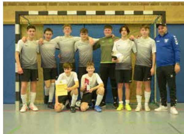
TuS B1-Junioren: Sieger in der SBFV-Futsal-Hallenmeisterschaft in Lörrach (zusammen mit Spieler vom FC Wittlingen)