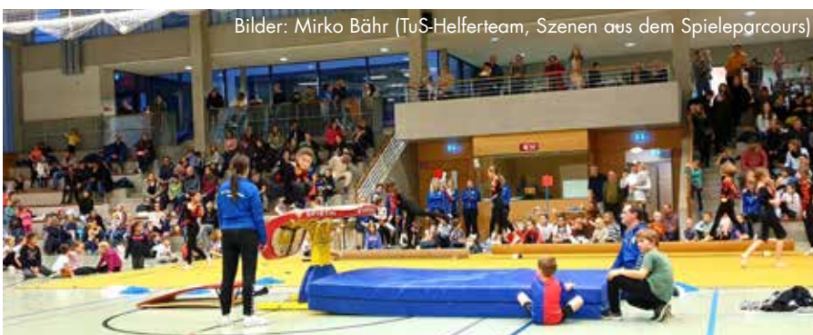
Bilder: Mirko Bähr (TuS-Helferteam, Szenen aus dem Spieleparcours)