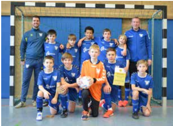
TuS D1-Junioren: Vierter Platz bei der Endrunde der Hallenmeisterschaft in der Lörracher Wintersbuckhalle am 12.02.23.

getragen werden mußte. Nach Punkt- und Torgleichstand zwischen dem FV Lörrach-Brombach und dem TUS-Stetten kam es zu einem Entscheidungsspiel beider Teams, bei dem unsere Jungs unterlagen.