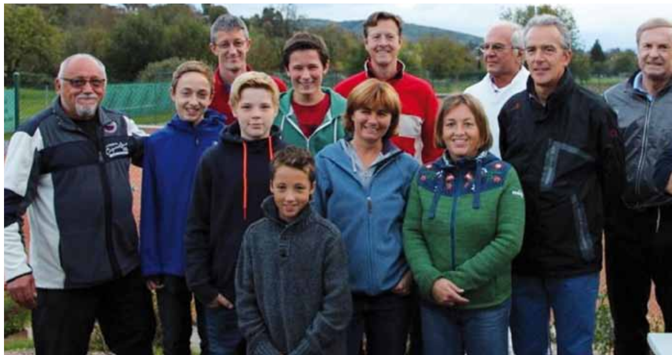
Die Gewinner der Vereinsmeisterschaften in 2012