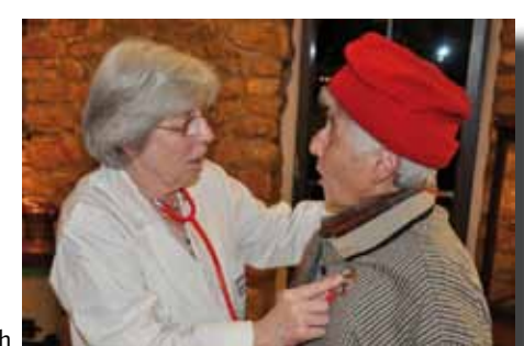
und der Sketch