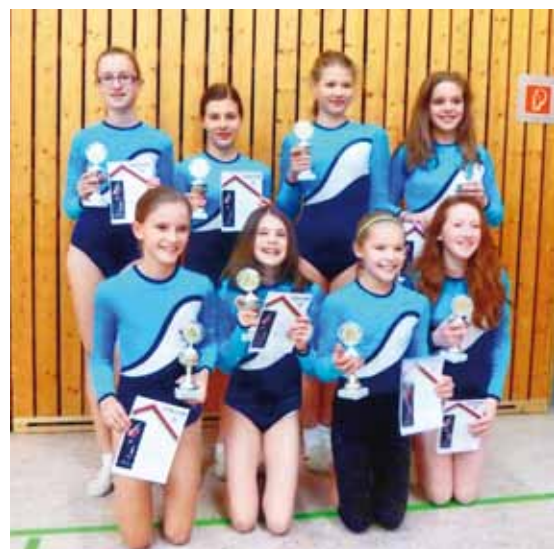
25.11.12 - Gauliga-Endkampf

Trotz einem anstrengenden Jahr 2012 präsentierten sich die Mädchen am 01.Dezember bei der Nikolausfeier mit einem gelungenen Auftritt.